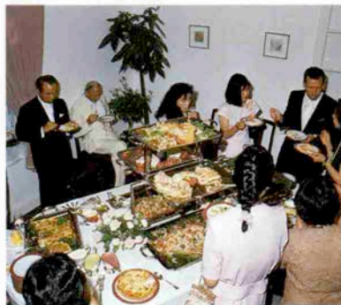
シェフが腕によりをかけたパーティ料理。

「ウワァ素敵ねノ異人館で結婚パーティですって」通りがかりの人々は早速カメラを向けている。異人館の門には大きなピンクのリボン、玄関口の素敵な白いバラのスタンド花が二人を祝福しているようだ。