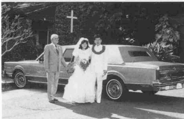
(上) ハワイはやはり施設が一番充実している。 (下) 結婚式をハワイであげるカップルも増えている。