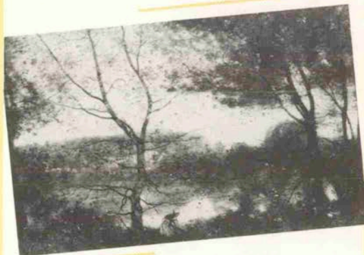
コロ「ヴィル・ダヴレー」

開館時間/10時～17時(入館は16時半まで) 入館料/一般900円 高大生700円 小中生500円 休館日/月曜日