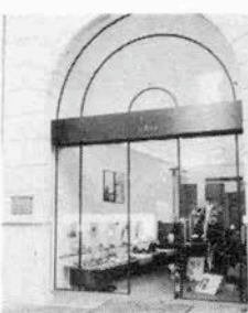
オープンした「デ・ノボ」

「ワールドの新ブランド「デ・ノボ」ハ英語に訳せば「THE NEW」(あらたに)となるVに注目。「一九四〇年代をあらたに」という意味を込めて、ファッションにおける新しい出発をきっている。シューズマーケットのなかで感性を切り口にしたトータルファッション(靴を中心)を展開し、新しいクロスオーバーマーケットの開拓、創造を計ったもの。ステファン・ケリアンなどの靴を中心