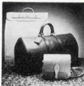
新作コレクション 「エビ」

カラーは、ボルネオグリーン、トレッドブルー、ゲニヤブラウン、ナチュラルベージュ、