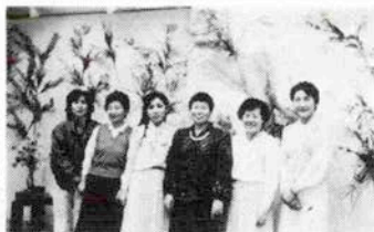
そのめ花に包まれて...

加工をして生まれたのが、透明感を持ち、カラと音のするアートフラワー「トランスバレン」。