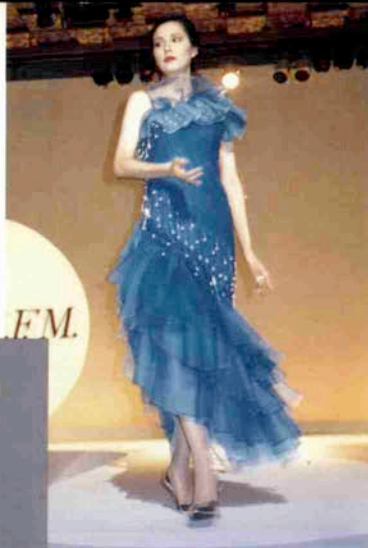
〈はらかなインド洋〉