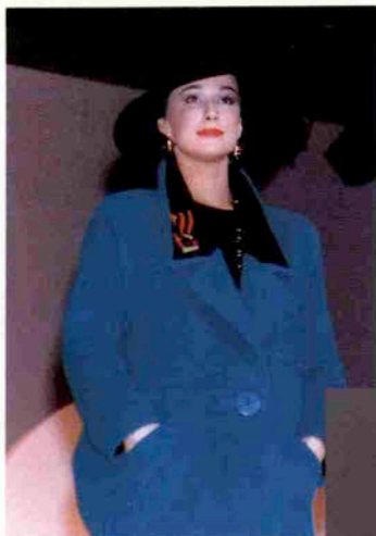
〈鉢下りのチューリップ〉