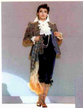
〈小公子セドリック〉