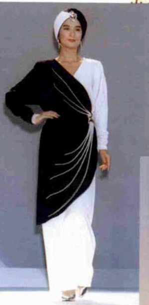
〈インドのヘビ使い〉