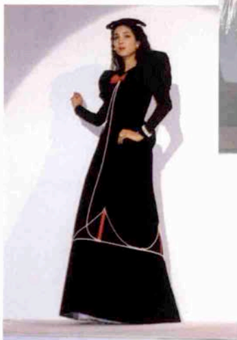
〈ゴールデンゲイトブリッジ〉

11月19日本社ビル完成 ポートアイランド ファッションタウン 〒650 神戸市中央区港島中町6丁目4-1 ☎ 078 (303) 2121