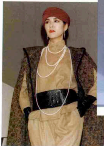
〈カンミールのバザール〉