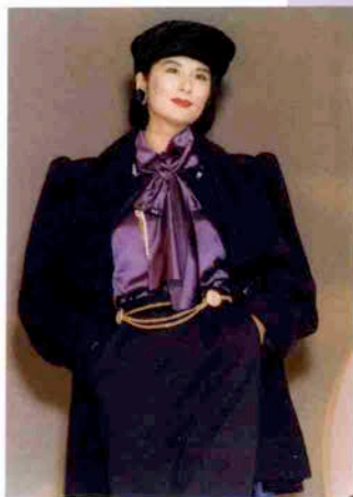
〈パレロワイヤルの回廊〉

〒650 神戸市中央区三宮町1丁目 さんプラザ2F TEL. (078) 331-7952