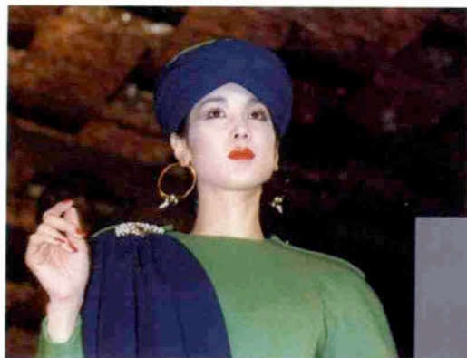
〈ニューデリーの街角〉