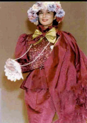
〈おしゃれなティータイム〉