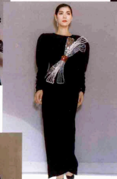
〈カルチュラタンの夜〉