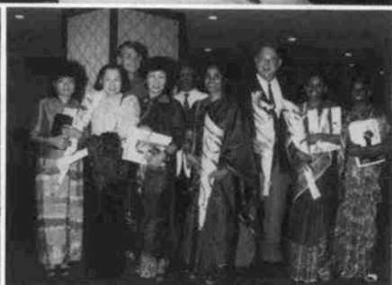
(左上)米山ママコさんと共に6人のモデルたち(右上)パールとの出会いのフィナーレ(左下)英国運輸大臣ご夫妻と共に坂井知事 (右)今、世界は神戸のテーマにふさわしく在神インド人の方々と

★京阪神ファッションマンズが 十月一日からスタート。初日は京 都でシンポジウムが、そして神戸 では「K・F・M」(ゴウベファッションモデ リスト)の'85ファッションショーと、 神戸ファッション市民大学が篠田 正浩監督の講演で開かれた。