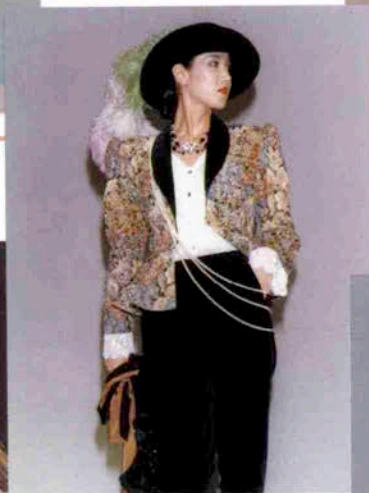
〈アガサの危険な女〉