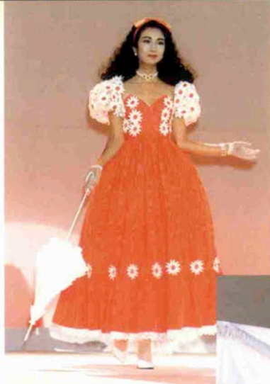
〈スカーレットの恋〉