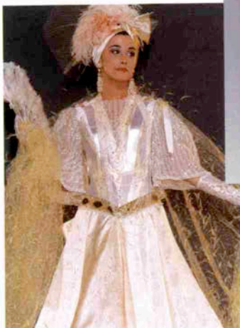
〈マイフェアレディ〉