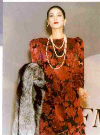
〈マキシムでお食事〉