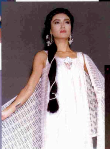
ギリシャ/ディオニソス