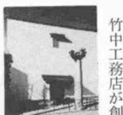
竹中大道具館 記念事業として創立 業として創 立ち ゆかり の地神

戸に大工道具の資料館を創設する。地上3階、地下1階、延面積900㎡の同館には日本の長い木造建築の歴史を築いてきた工匠の心と技の結晶である大工道具約9千点、関連資料千点が収蔵される。また実際にその道具がどう使われていたかという無形の技術を伝えるため、ビデオコーナーも設けている。昔は大工たるもの、最低170点の道具を必要としていたらしい。その道具も鍛冶と大工がお互いに技術を競い合うなかから多種多様なものが生まれた。しかし機械化の波とともにそれらの大工道具も消滅しつつある。世界にも余り類