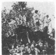
も勇壮なシャントセーもある住吉だんじり祭り

住吉神社の例祭は「灘のだんじり祭」として広く知られ、毎年、5月5日に行なわれている。だんじりは7基出され、順次「シャントセー」を演じる。それは拝殿正面にだんじり正面をむけ、曳き手の三分の一が後方へ乗って、残りの曳き手でだんじりを3回高くあげおろし、神社に拝礼したのち、前輪を浮かしたまま3回右回りに回す儀式。