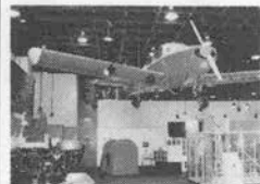
飛行機の実物大模型も展示