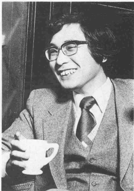
「ハングリーな状態から芸術が生れるとは思えないんです」 神山伯爵