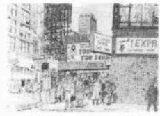
風景 商品も販売され、スクエアタイムズ・スクエアというおまけつき。今年

3日より7日間、そごう神戸店、6階美術画廊で開かれる。グリニッチ・ビレッジの街角、ブロードウェイなどの最もNOWい姿を永沢さん独特のタッチで見せてくれる。また、地下鉄の乗客たちを描いた作品も出展されるとあっては見のがせない。永沢さんオリジナルデザインのコのキヤラクター商品も販売され、スクエアタイムズ・スクエアというおまけつき。今年