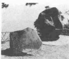
須磨の海が見える蕪村の句碑 (速水史朗・作)

江戸の俳人、与謝蕪村の名前は知らなくても、「春の海、ひねもすのたりのたりにかな」の句は小学生にも馴染み深い。この名句、実は、須磨の海をうたったも