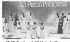
風景 欧米などへの真珠のPRや国際親善のPRや国内の真珠キヤン