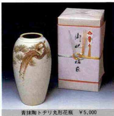
青抹茶トドリ丸形花瓶 ¥5,000