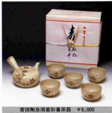
青抹茶急須着彩番茶器 ¥6,000