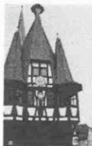
ベルリン市庁舎 ミット

★レイクタホ6日間 出発日/2月19日、3月4日、18 日、4月1日 費用/¥331,000(大阪発) 内容/サウスタホ(5泊)、サン フランシスコ(1泊) 毎朝食付。 米西海岸最大のレイクタホスキ ー場で陽気で型破りなスキーを お問い合せ、お申し込みは幹セ ンラルツアーズ(センタープラザ 西館3F)(392) 2008 ★ドイツワインとロマンの旅 16日間 期間/6月8日出発、23日帰国 費用/¥478,000 旅程/大阪→フランクフルト→ベ ルリン市庁舎 ミット