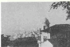
＜神戸っ子愛読者サロン＞

★年末で多忙のことと思います 去る11月26日に着き、はや1週間 余たちました。やはり寒いです。 リ・クサンブル公園の池に氷が はっていました。ホカロンを身に つけてスケッチに頑張っています。 す。こちらでもサンゼリゼ、モン パルナス通りにクリスマス飾り がつつけられ、デパートは子供づれ