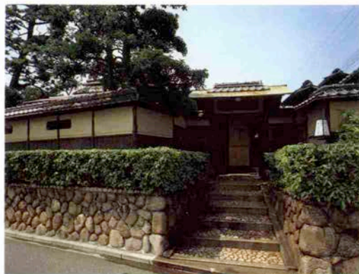
わらびの里芦屋店