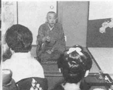
「江戸っ子だから関西じゃ早口過ぎるつてね」

人間の財産で何だと思う？ 金じゃない、信用です。信用とは人が言つて用いと書くでしよ。仮りにお金を持つてても、人を倒しちやイケないね。「倒されし竹はいつしか立ち直り、倒せし雪は消えてなくなる」つてんだ。倒した雪は溶けてなくなつちやうよ。だけど辛抱してた竹はしなつて立ち直る。人を倒しちや駄目なんだ。あのね、激流にもまれると石は丸くなるだろ。人間ももまれりや丸くなるんだ。しかも大きな石ほど川上にいる。小石ほど川下に行つ