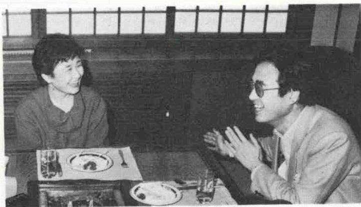
笑い声が絶えない喋喋不休の対談風景

内藤 ところが芸能界は、タダの仕事して、頭下げないかんからねエ(笑)歌わせていただく、聴いていただく(笑)今、サラリーマンは四人に三人位は潜在胃潰瘍みたいなものだっていうでしょう?対人関係に神経を使っている。棋士は朝まで酒飲んだり、麻雀しても胃潰瘍にならない。知らない人は「将棋士って神経使うでしょう」