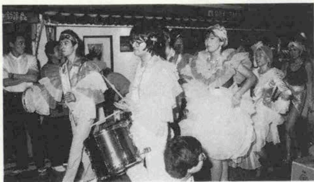
昨年の「有馬のカーニバル」にはサンパチムも登場した

子供たちの楽しめるほのぼのとしたゲ ームや大人には「楽しいベースボールゲ ーム」と題した④ゲームが予定されてい ます。親子そろって参加してください。 5日の夜はサンパチムでファイバー。月刊神 戸っ子サンパチムと一緒に若いエネル ギーを発散させてください。