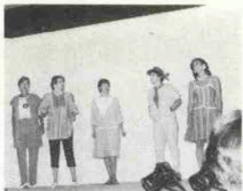
堂々としたモデルぶり

★チャーターミニングな着こなしと歩きぶりに喝采 恒例行事になった K O B E W O M E N ' S C L U B 主催の春の行事、コーディネートフ ァッションショーが5月10日、神戸外国倶楽 部で開かれた。剛ダイエーの協力により、ス