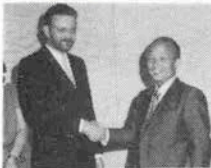
神戸ポルトピア ホテルにおい てオールスタ イルのギィ・ ポーラン初来 神

フランスのギィ・ポーラン(37歳)は、今 ブレタポルテ界でもっとも注目されているフ ァッションデザイナー。この度兼松江商との ライセンスが成立し、オールスタイルの よるウェア部門の製造・販売が内定した。