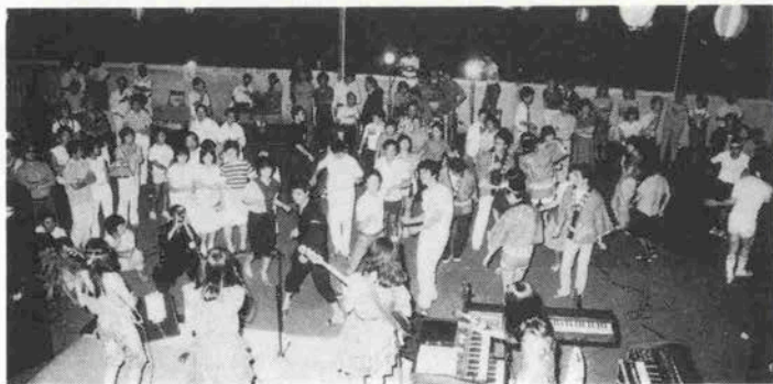
熱気にあふれる「有馬のカーニバル」

今年から新たに登場するイベントで す。去年できたゆけむり広場でちよつと なつかしい夜店が開かれます。あてもん やさん・おもちやさん・アイスクリン やさんなど趣向を凝らしたお店がいっぱ い。また、びい玉・めんこ選手権大会も 予定されていますので、ガキ大将の方もそ うでない方もぜひ腕を試してみたいか が。ほのぼのとした子供の頃を思い出し てください。ほたるの出没する有馬の 夜、浴衣などを着てそぞろ歩きをしなが ら昔風の縁日をどうぞ。