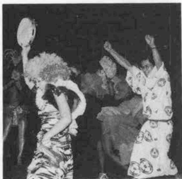
宿泊客も思わず踊り出した

昔なつかしい鎮守の森の盆踊りを再現 新旧の有馬音頭はもちろん、盆踊りに欠 かせない曲ばかり。太鼓の音が響きま す。