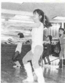
力強いアクションで

的に紹介しているアメリカのAFAのオフィ シャルであるNAFAを例JUNが発足し、 2月末より神戸三宮GARROに登場した。イン ストラクターも本場アメリカから派遣。チ ェット制で自由に参加でき楽しくレッスンで きる。本物の美しさは決して綺麗には生まれ