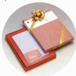
贈答にギフト券や仕立券付生地を

己主張 が感じ られる よう、 個性が ひきた つ柄や デザイン を、 逆にビジネスマンには、職場の雰囲気 にマッチしたものを心がけておられる。 布地は国産、舶来とも天然繊維に圧 倒的な人気があり、フィスパー、ハウ ザーマンといったブランドの上質綿で 仕立てるドレスシャツなど最高のおし