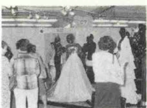
満意が出そうな豪華なイブニング

パリのオートクチュールの第一人者、ユ ベール・ド・ジバンシウィークのメゾン創立30周年 を記念して、日本でも盛大なショーや30周年 回顧展が全国各地で開催された。大丸神戸店では 5月10日、フランス総領事や店長によるテ ィアップカットで回顧展が始まり、一週間で1万