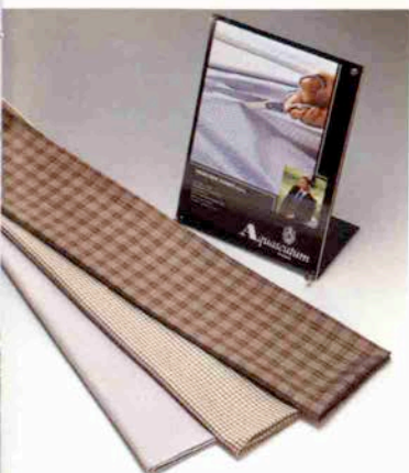
この秋より新発売されるアクアスキュータム

一枚にも自 は、シャツ 由業の人に バイスも自 うだ。アド 薄があるそ 三万人の名 店だけでも で、神戸本 ステムなの 型紙と見本布地は永久に保存されるシ