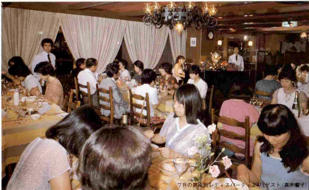
7月の第4回レディスパーティより(ゲスト/真木麗子)