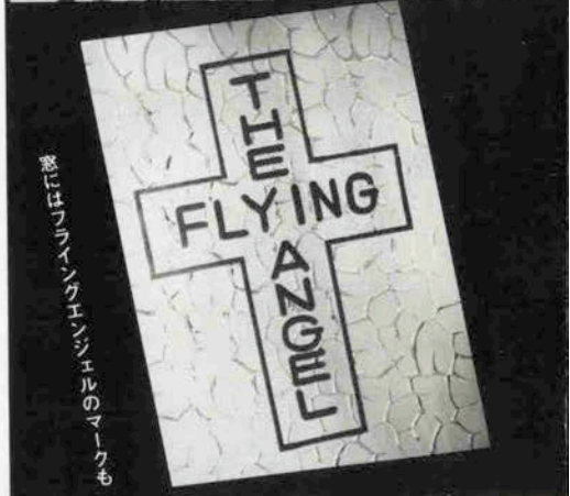
窓にはフラインクエンジェルのマークも