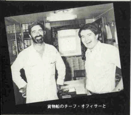
貨物船のチーフ・オフィサーと