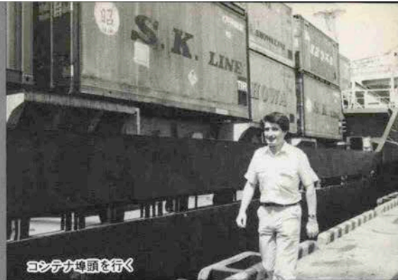
コンテナ埠頭に行く