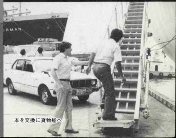
本を交換に貨物船へ