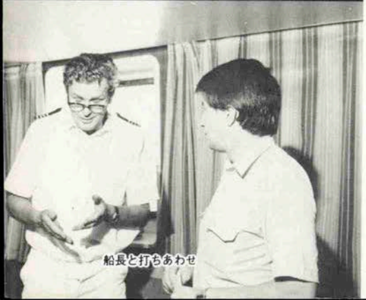
船長と打ちあわせ