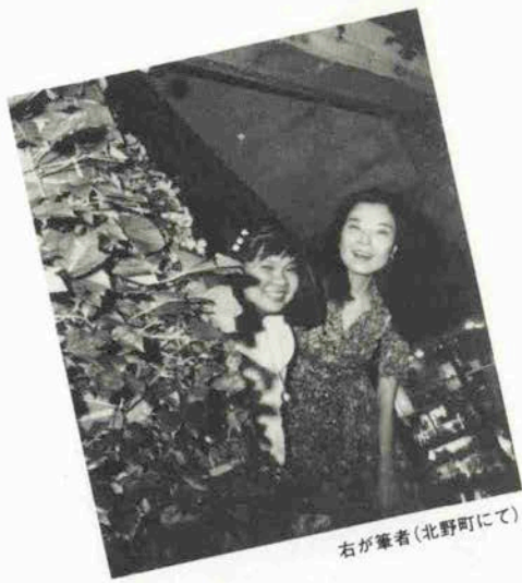
右が筆者(北野町にて)

こんな彼女に会って、とってもフィリップンに行きたくなりました。そして、フィリップンの人達をもっと知りたくなりました。