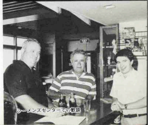
シーメンズセンターでの歓談

話をつけた。船員たちが本を交換するあいだに、話を伺う。「色々和談を受けるんですが、最近多いのは給料の問題ですね。船員、船籍、船会社等が各々別の国籍ということも珍しくないので、給料の支払いが遅れたり、システムがよくわからないということもあるようです」