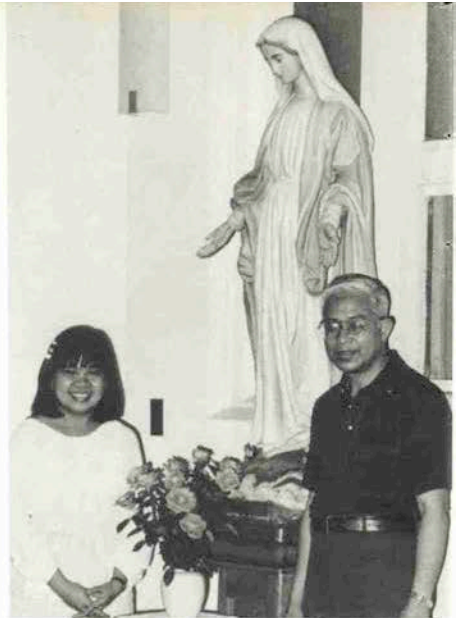
大留田存・勉者民(O・A・ベンジャミン)神父とともに