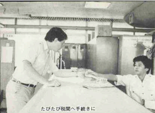
たびたび税関へ手続きに