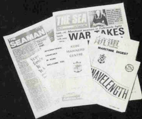
シーメンズセンターにある出版物