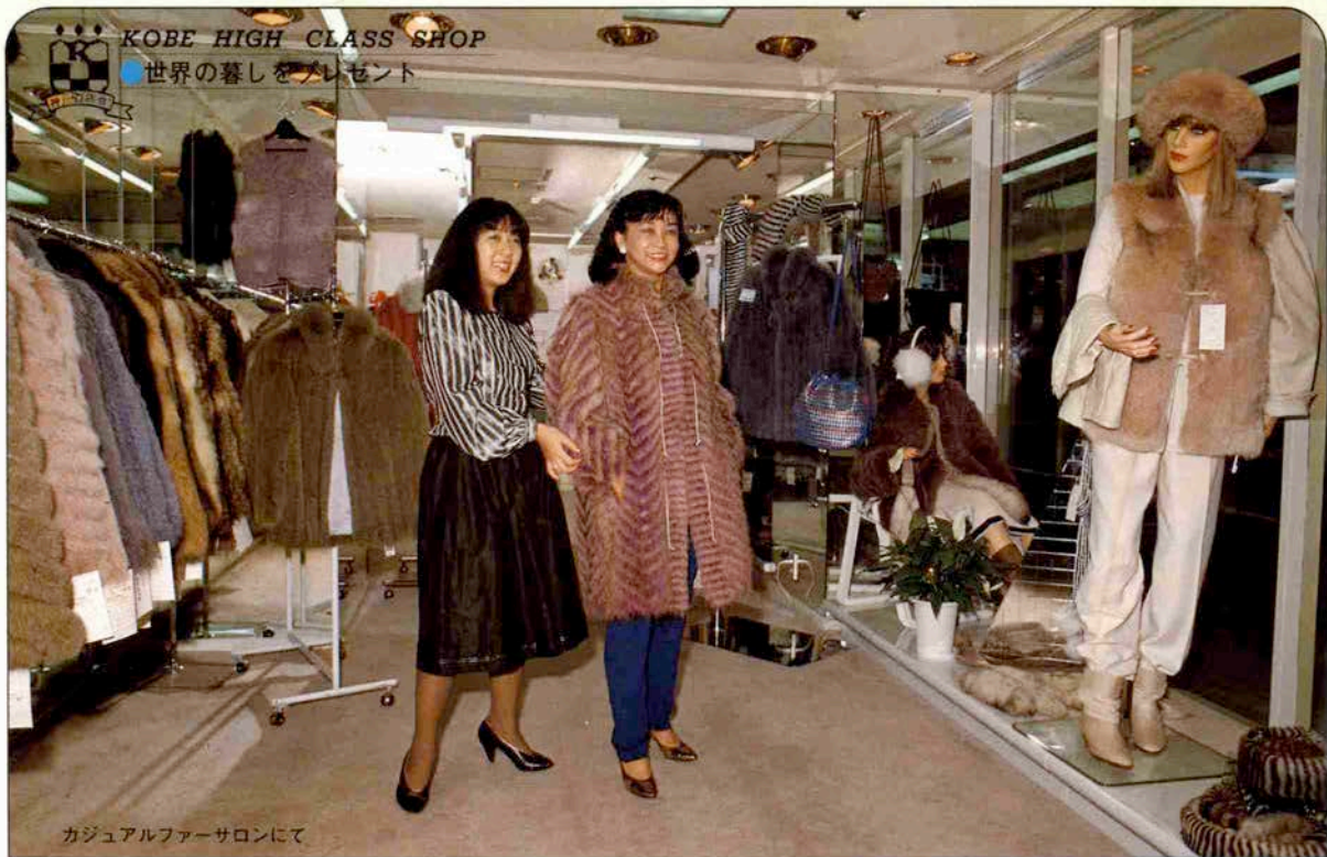
カジュアルファーサロンにて