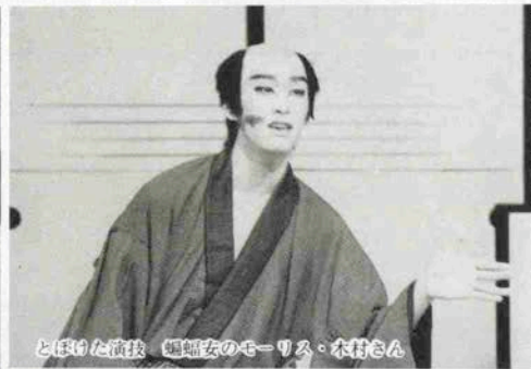
と任けた演技 婦孺女のモーリス・木村さん