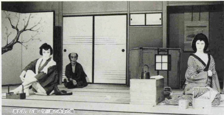
源氏店、お富・与三郎の再会の場