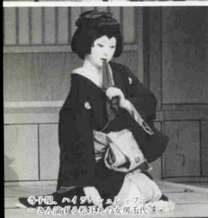
寺子屋、ハイジトシュレップ さん演ずる松玉丸の女房王代