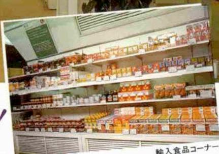
輸入食品コーナー