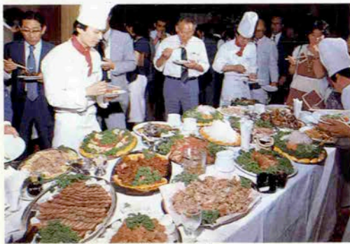
夢香亭オープニングパーティ