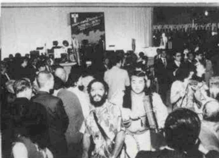
迫力のあるサンバチームがフィナーレを