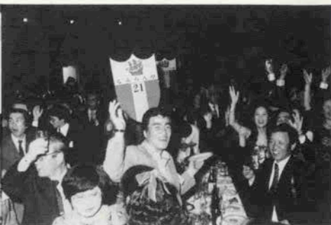
いつも元気になるふらん亭