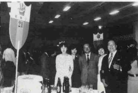
柿沼院長もごひいきの果林亭