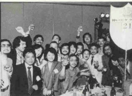
今年初登場のユニークなヒゲクラブ