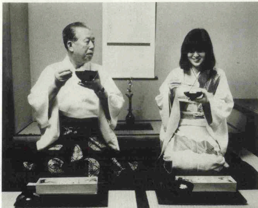
生田神社茶室「梅陰亭」にて