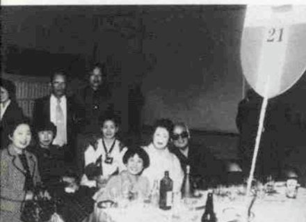
しゃねるのママも健在！今年も飲みましょう