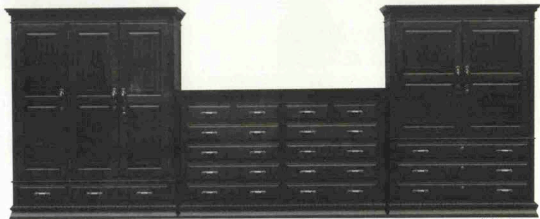
橋材無垢板使用江戸屋オリジナルご婚礼家具セット