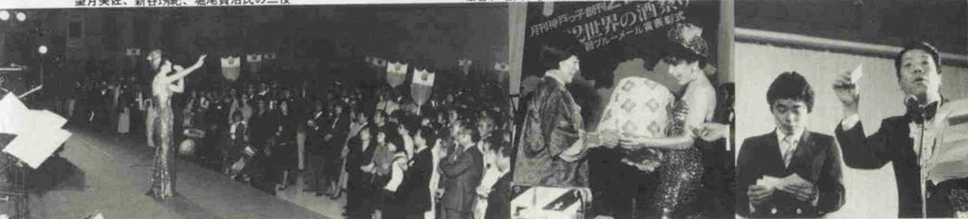
ゲストの弘田三枝子に聴き入る会場の人々