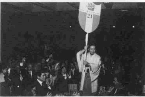
恒例キャンティの紳晴夫マスターの和服姿