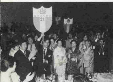
二代目も揃って華やかな布引大しま亭