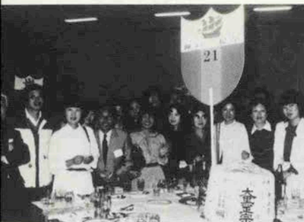
賑やかさでは負けません、神戸二紀亭