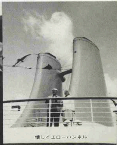
懐しいイエローハンネル