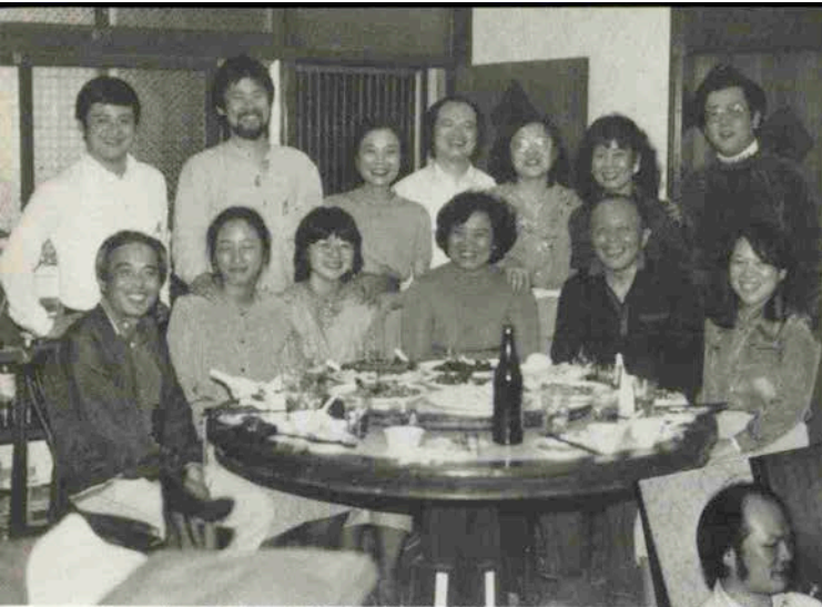
荘さん宅では美味しい本場の中国料理をご馳走になった。右は荘さん夫妻。