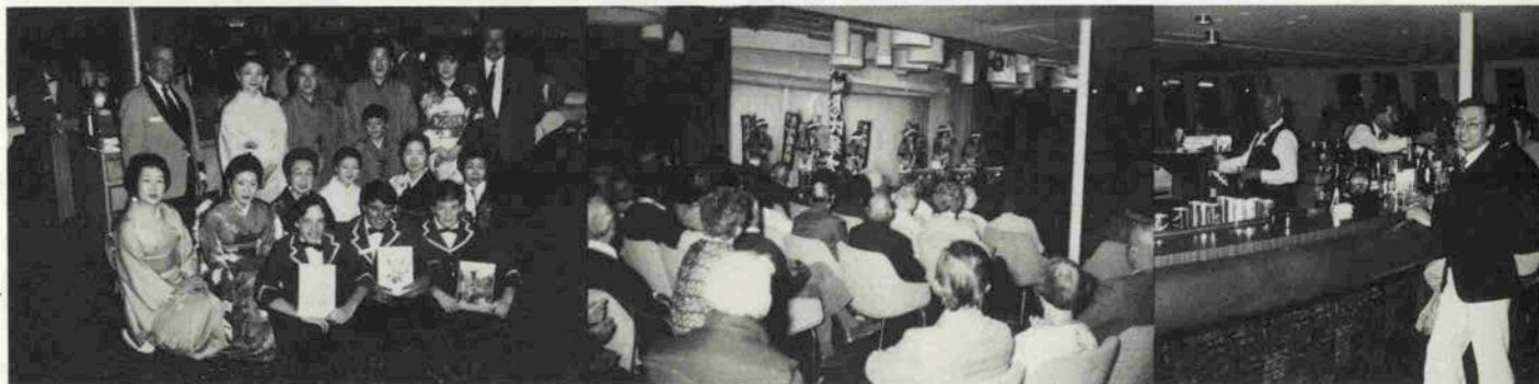
若柳吉金吾チームがディナールームへ

キャンベラ号が日本へ入港しなくなつて、久方ぶりにバルセロナ港で見た時の、黄色い煙突の愛らしかったこと……。そしてエルバ島ナポリ、ピゴ、マラガからジブラルタル海峡を経て、サザンプトンへ入港して、下船するときの別れのつらさ。船旅は、入港すると気軽に、あちこち観光旅行ができるし、海上の時は「ギャプテンの招待パーティー」「フレンチナイト」「スペインナイト」「ハワイアンナイト」「仮装舞踏会」「オリエンタルナイト」「ジョッキーマイト」が開かれる。「レディスナイト」に到つては男性の乗客すべてが白のタキシードに一変する。その夜の男性の美しかったこと……。朝から女性が創ったバーバーカーネション一輪を捧げられると、どんな相手であらうとダンスを一曲踊らねばならない。喜ぶ女性と夫婦げんかが始つたり。まあ船内で、お金をかけずにエンジョイさせる見事さは、それ以来、神戸でもパーティー狂になつてしまったから押して知るべし。そして船とのつきあいも深くなつて、クイーンエリザベス号の入港以来、神戸へ入港した船で、