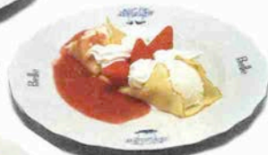
いちごとアイスクリーム クレープ