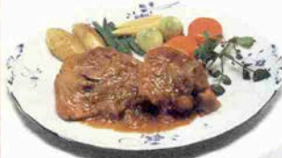
オツノ ブツコ 骨付肉の煮込み料理