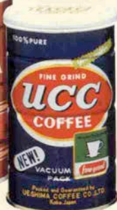
UCCオリジナルコーヒー・200g缶 (ニッパフルター用)

ホッとひと息つけるのは、やはりわが家。 みなれた風景だけど、あたたかさがある。 やさしい笑顔が今日を忘れさせる。 英気を養うゆったりしたひととき、 炒りたてひきたての味と香りをあなたに。 ころを熱く満たす充実の一杯、 豊かな香りUCCレギュラーコーヒー。