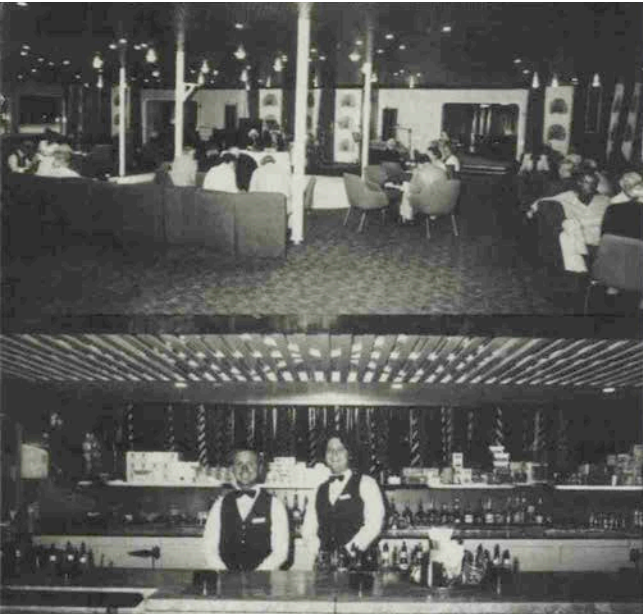
上・ゆったりとしたサロン 下・人気バーのクリケットルーム