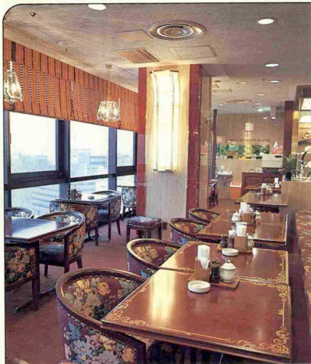
三宮ターミナルビル11階 スカイレストラン街 ケーキレストランベル