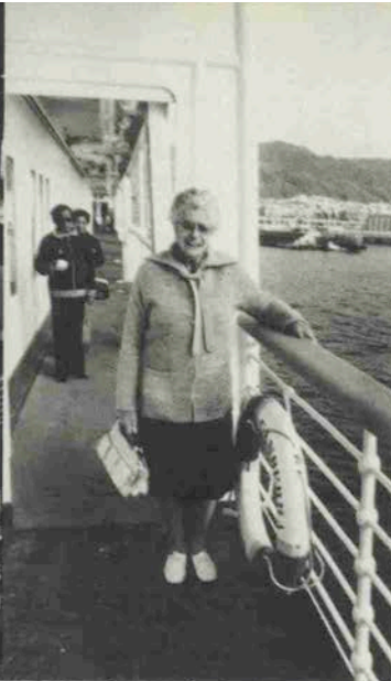
神戸港のみえるサンデッキ