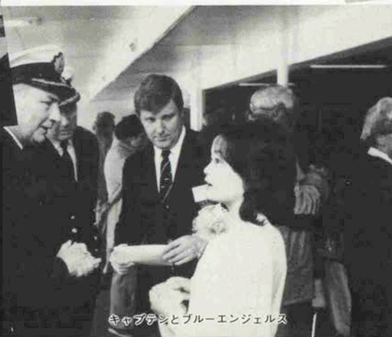
キャプテンとブルーエンジェルス