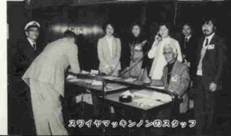
スワイヤマッキンノンのスタッフ