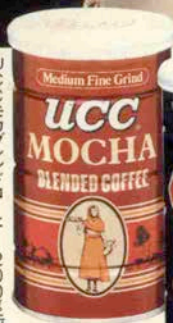
UCCモカブレンドコーヒー・200g缶 (ニッパムフライングデザイン)