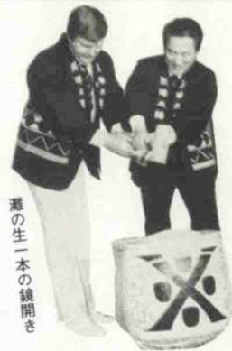
灘の生一本の鏡開き