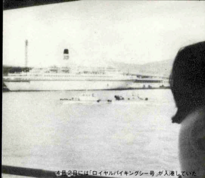
4月2日には「ロイヤルバイキングシー号」が入港していた