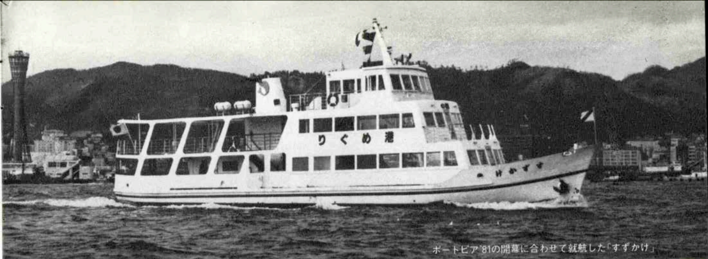
ポートピア'81の開幕に合わせて就航した「すずかけ」