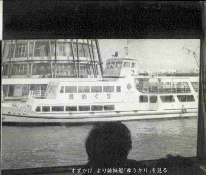
「すずかけ」より姉妹船「ゆうかり」を見る