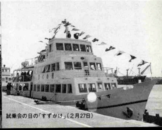
試乗会の日の「すずかけ」(2月27日)