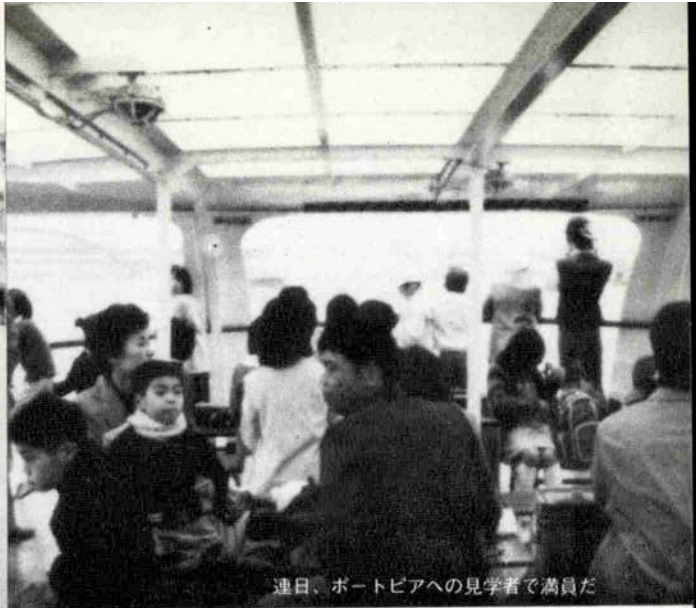
連日、ポートピアへの見学者で満員だ