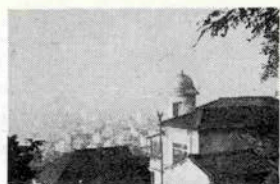
＜神戸っ子愛読者サロン＞