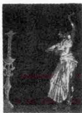
魅惑の東南アジア