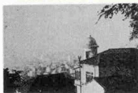
＜神戸っ子愛読者サロン＞

★私と昨年の暮に主人を敗血症のため急に別世界に持って行かれ、途方に暮れましたが、廻りの皆さんの暖かい励まし、少しずつ立ち直ってまいりました。これもある方の善意で三月に「ナッシュンシ」のお手伝いをさせていただき、新しい世界の目を