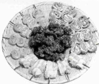
●今月の味覚● 身巻・しそ巻・うめささ身

身巻は鶏肉をトマトソースで味つけた濃くのある風味です。しそ巻は特製のタレで召し上っていただきますが、鶏肉と香ばしいしその味がうまくミックスされています。うめささ身は塩味で焼いたささ身に梅肉をのせたアッサリとした味です。このようにトリドリでは、一品一品で風味が異なり、味のバリエーションをお楽しみ頂けます。