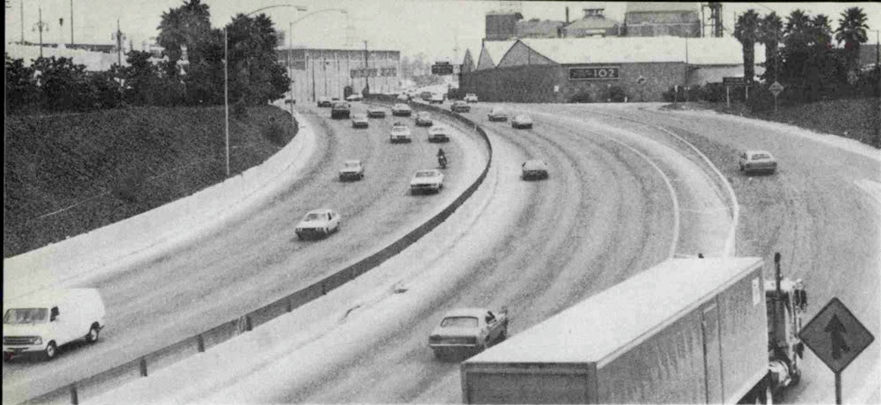
ロスのフリーウェイ。信号がないので快適なドライブが楽しめる。

スを来る日も来る日も、ただ歩いた。いろんなことを語らいながら、時にはアイスクリームを食べたりすることもあった。