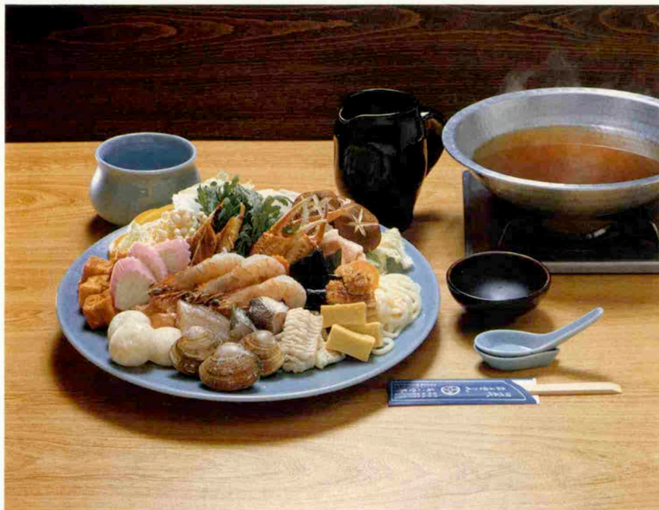
あこや鍋(うどんちゃんこ)