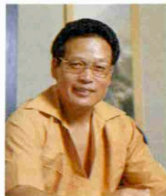
中西 太さん 阪神タイガース監督

私は讃岐生まれだけに、うどんにはうるさいというより通です。私のおふくろは、うどんを家庭で打てなければ一人前の主婦でないという時代の人でしたから、今でも粉をねかせて足で踏んでいる姿が印象に残っています。だから手打ちうどんというのは、まさしくおふくろの味ですね。 あこや亭さんのうどんは、腰があつていい。これは本当の讃岐の味ですね。最近、これだけのおいしいうどんには、めったにお目にかかれないですよ。