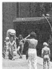
ロサンゼルス街角

★ビッグアメリカ7日間 日程/11月5日→11日 B、11月9日→15日 大阪→ロサンゼルス→大阪 費用/¥173,000 (会員特別価格) オプショナルツアーも各種あります。お申込み・お問合せ