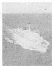
コーラルプリンセス号

Rコースもあります。 お問合せ・お申込みはドッドウェルトラベルサービス(暮谷区明治生命ビル) 251-0021 ★トロピカルリゾート・プンタルアルテとマニラ4日間 日程/11月21日→24日 費用/¥135,000 (ホテル・食事・市内観光費用含む) 大阪→マニラ→プンタルアルテ→マニラ→大阪 お問合せ・お申込みは大丸トラベルサロン大丸神戸店6階 331-8121 担当/大畑