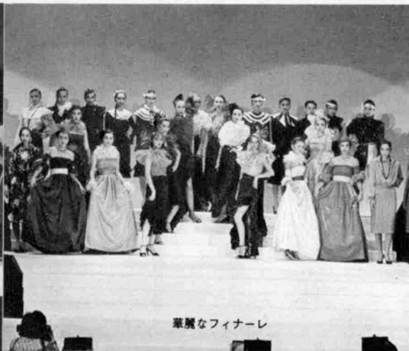
華麗なフィナーレ