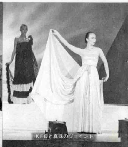
KFCと真珠のジョイント