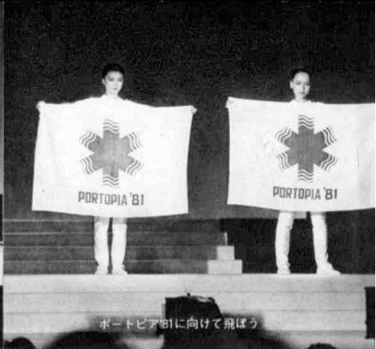
ポートピア'81に向けて飛ぼう