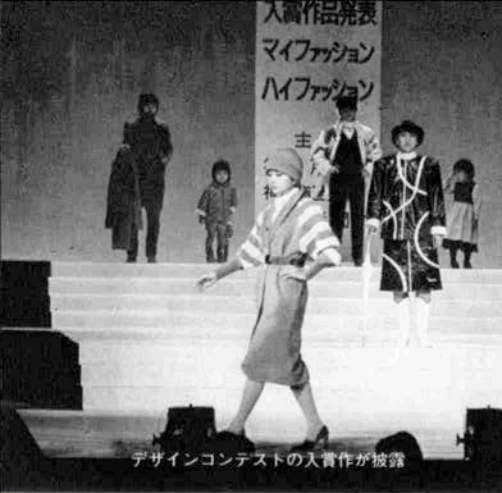
デザインコンテストの入賞作が披露