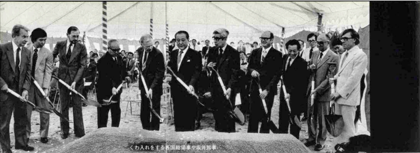
くわ入れをする各国総領事や坂井知事