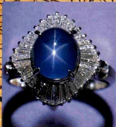
スターサファイア

タジマでは宝石の鑑定を無料でご相談に応じておりますのでお気軽にご利用下さい。 定休日は水曜日です。