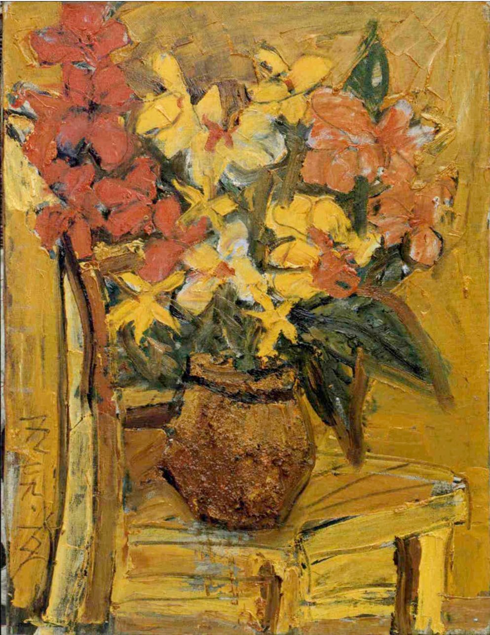
「花」 P 12号

消滅する。一つとは全体のことであり、否定とはエゴイズムの否定であり実践体験行動の持続である。生命の全体顯現の重々無尽。エゴイズムの否定された種子の創造。長い長い時間の大冒険、大忍耐、大勇氣、大破壊、純粹性靈感直感。それが作品の感動です。