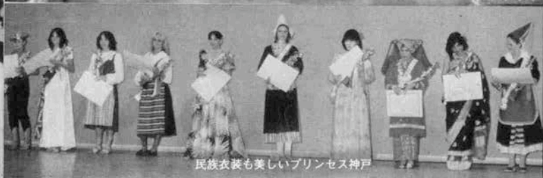
民族衣装も美しいプリンセス神戸