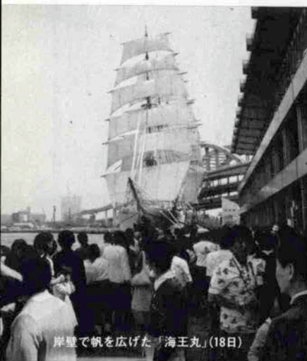
岸壁で帆を広げた「海王丸」(18日)

大型練習帆船「海王丸」が5月に寄港したが、17日夜、ポートターミナルにて「ハーバーライトパーティインポートオブコウベ」が同船乗組員らを迎えて行われ、18日にはセールドリル訓練が一般に公開。29日には登しうれで市民に別れを告げ遠洋航海に旅立った。