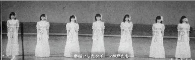
勢揃いしたクイーン神戸たち