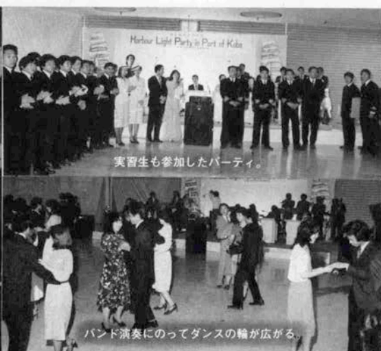
実習生も参加したパーティ。