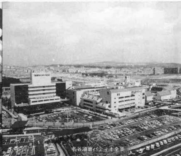
名谷須磨パティオ全景