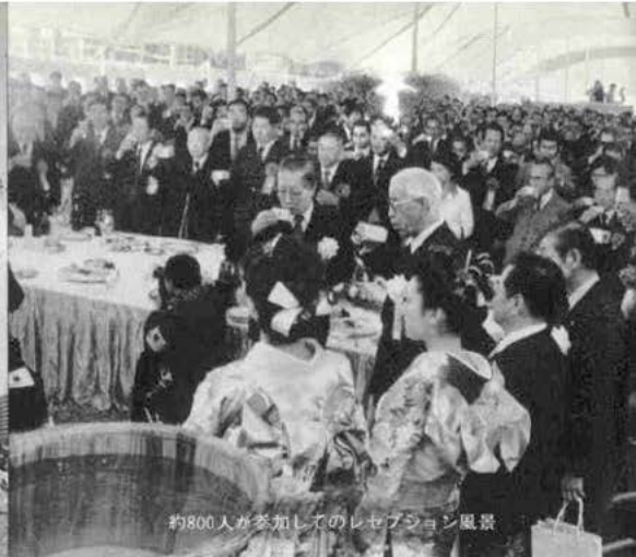
約800人が参加してのレセプション風景