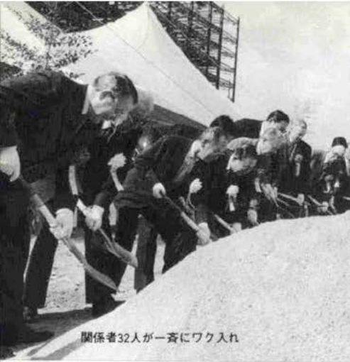
関係者32人が一斉にワク入れ