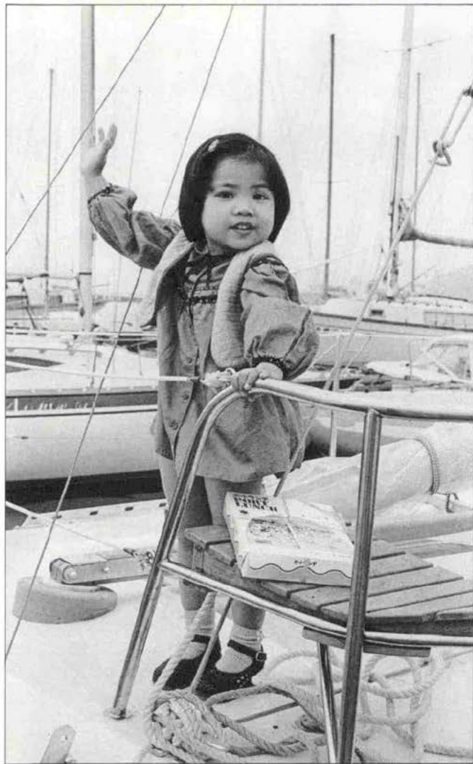
西宮ヨットハーバーにて