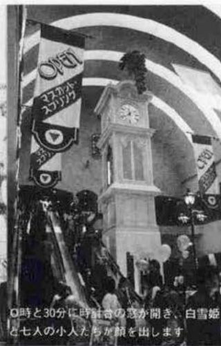
0時と30分に時計の窓が開き、白雪姫と七人の小人たちが顔を出します