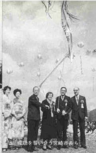
成功を誓い合う宮崎市長ら