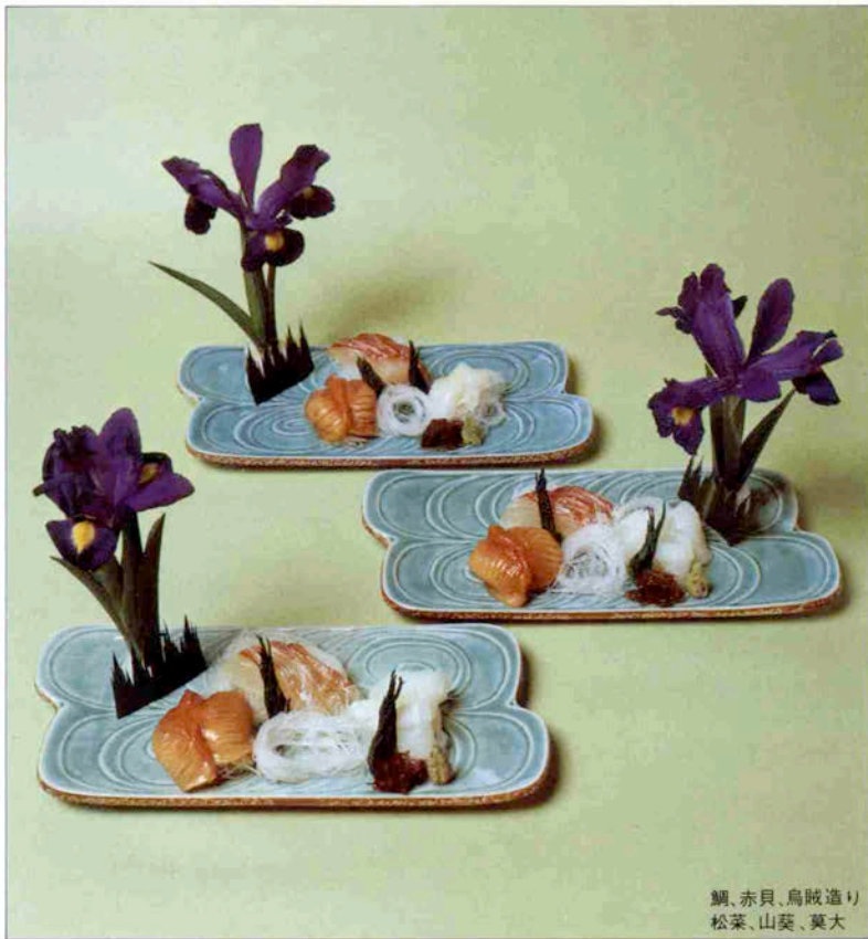
鯛、赤貝、烏賊造り 松菜、山葵、莫大