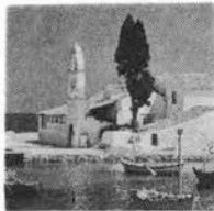
エーゲ海と白い家

日程/6月11日、19日 費用/¥390、000 大阪・パリ・アテネ・ロードス アテネ・大阪