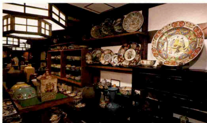
赤絵伊萬里は江戸初期のものをコレクション。いい器で美味しいお料理を。