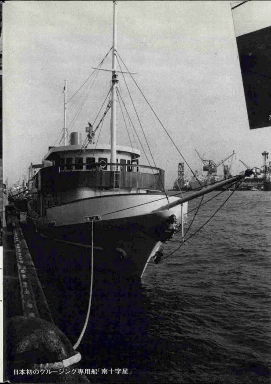
日本初のクルージング専用船「南十字星」