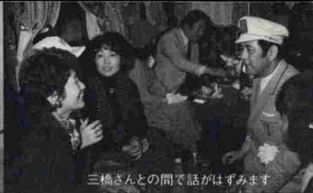
三橋さんとの間で話はずみずみ