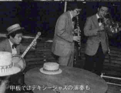
甲板ではデキシージャズの演奏も