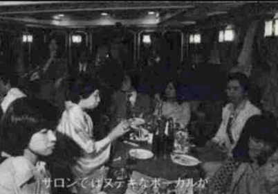
「サロンではステキなボーカルが」