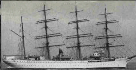
この日、沖には「日本丸」が停泊していました