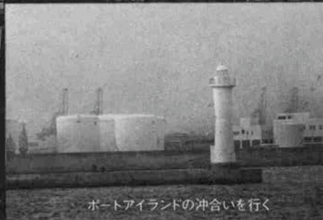
ポートアイランドの沖合いに行く

「瀬戸内海は島と島の間をぬって走るのがいい。そのためにも理想的な船型は、これ位の大きさですね。とにかく棧橋さえあればどこにでもつけれられる。また、ポートもあるの、無人島の沖に船を泊めて、ポートで浜へ上ってパーベキューをして、というようにいろんな楽しみ方を自分で考えていただく。いろんな遊びを考えられるように船をつくってあります」。