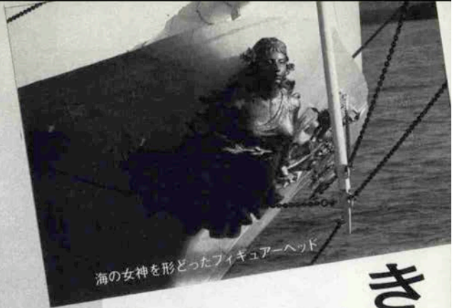
海の女神を形どったフィギュアヘッド