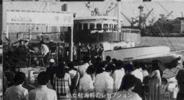
処女航海前のレセプション