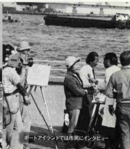
ポートアイランドでは市民にインタビュー