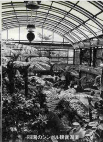
同園のシンボル観賞温室