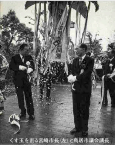
くす玉を割る宮崎市長(左)と鳥居市議会議長