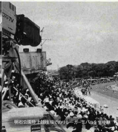
明石公園陸上競技場でのリレーカーニバルを生中継