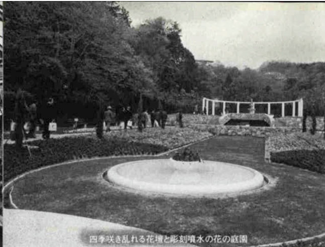
四季咲き乱れる花壇と彫刻噴水の花の庭園