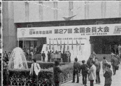
右上・記念式典でお言葉をのべられる常陸宮殿下 右下・記念式典会場の中央体育館前 左上・麻生日本J C会頭(左端)の案内で全国のJ C理事長夫妻に親しくあいさつをされる常陸宮ご夫妻(於相楽園) 左下・記念式典のメイン会場の中央体育館。