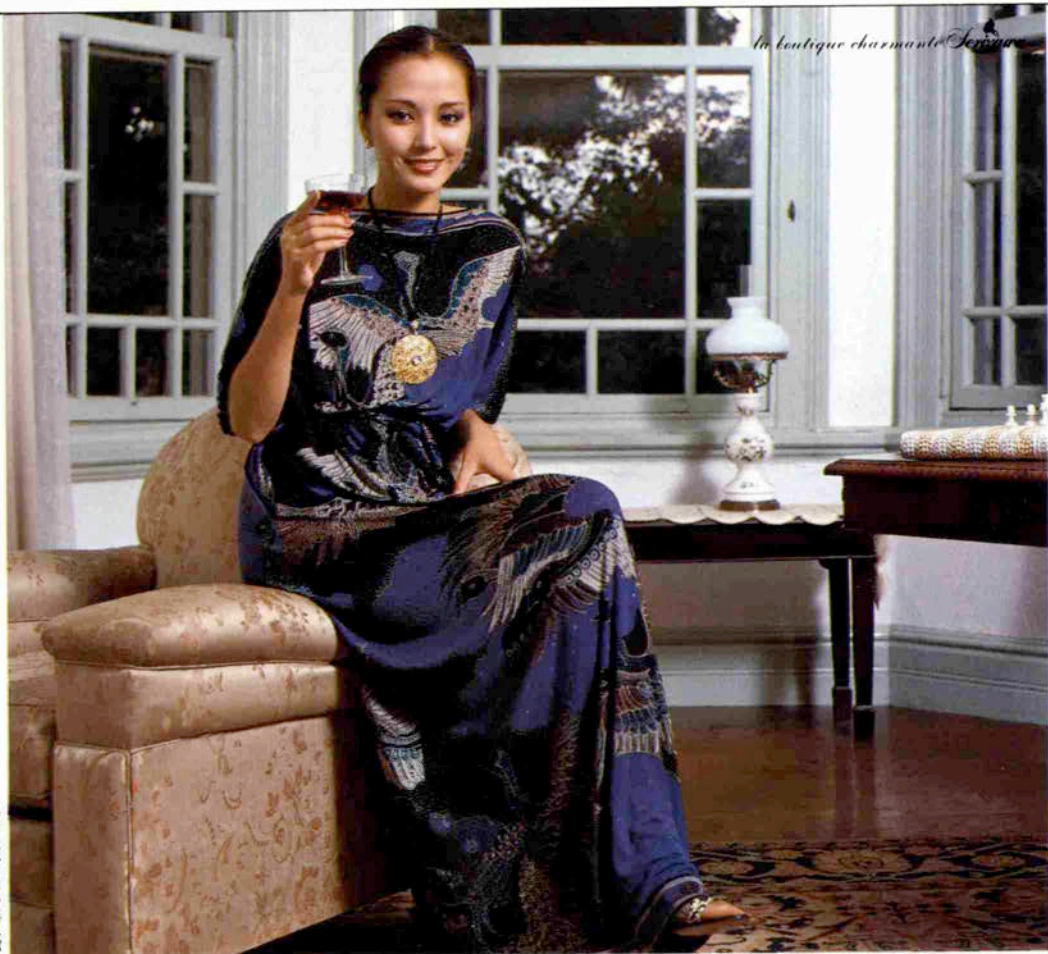
（神戸・北野・白い異人館）