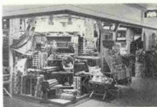
ホームソーイングのお手伝いならお任せ

★夙川グリーンタウン探訪(阪急夙川駅南側) に新しくできたショッピングゾーン) □DMカバ店(ホームソーイングの店) 手造りのお洋服が見直され、これから夏に向かってホームソーイングを楽しむ人が多い。織りやすい素材をコットンを中心に薄手のウール、ジョーゼットなど洒落た柄が店内にずらり。