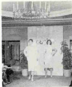
ペールカラーをどう着こなす？

桜の花風吹きの中であなたはどんなファッションに身を包みますか——リザ・サロンがおとどけするこの春はペールカラーの世界。2月10日(金)センタープラザ3Fのリザ・サロンで開催されたリザ・スプリングコレクションではイタリア・ミルサ社とワールドの共同企画による高級ニット、ポーシャルのドレスやイタリアのルチアーノ・ソプラニーの作品が紹介された。ルチアーノは素材の良さと美しい色が特徴の「アダルトファッション」。ルチアーノ・ソプラニーはアフリカをイメージにした自然素材を使ったジャケット、スーツなど。