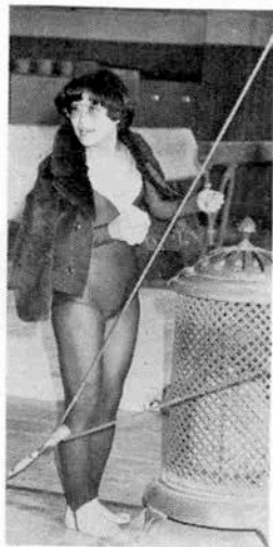
どう。私、合格でしょ

指導／行森 光 △武庫川女子大体操部部長▽ 協力／武庫川女子大体操部