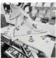
ディオールの新製品

カナルポベルエイシがその春発表したタリスチャン・ディオール、プレイボーイ、ハナエ・モリ、オリジナルのベガのタオルはそれぞれカラフルで楽しく特徴がよく表われ、用途に応じて使い分けられる。