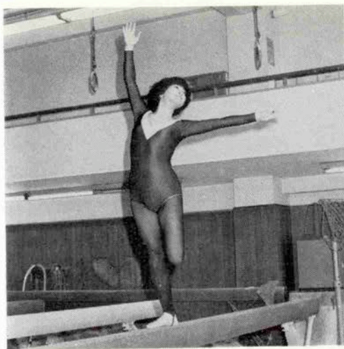
これで決まった！華麗なるポーズ