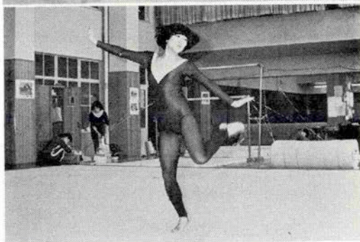
上 行森先生に武庫川体操部の輝かしい記録を聞く 中 ドッコイ。どうして起き上がれないんだろう 下 チャールストンの音楽にあわせて……