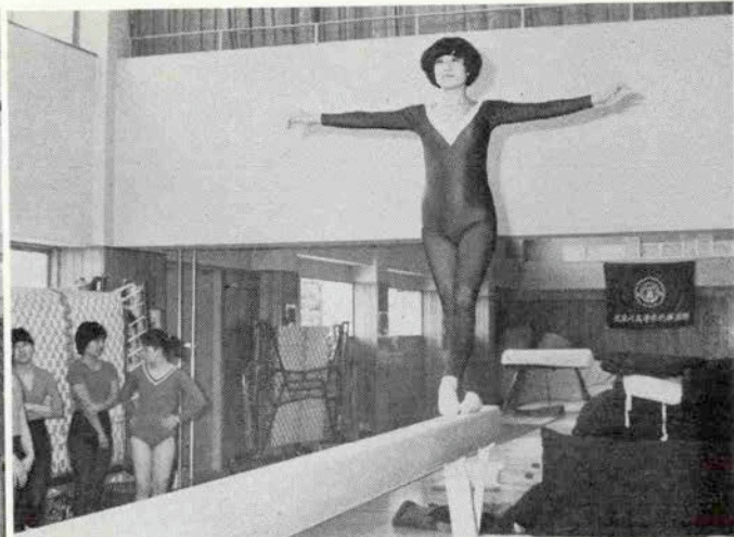
目は前を見て、決して足元を見てはいけません

がらも足はむなしく宙をけるのみ。次なることは前転開脚。いったん上で足を止め、開いてころがり、手をつかわずに立つ。こんなこと人間わざやと思いますか。昔からお転婆という烙印を押され、そのために嫁にも行けぬ私なのに、なんと逆立ちというのをやったことがない。何故か、首がぐしゃりといきそうで、とにかくこわいのだけれど、それをやれとのたまう。