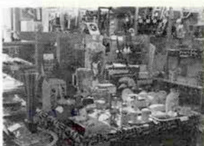
一見の価値あるステキなキッチンウエア

いわゆるキッチンウエアのお店。ホーロー鍋、おしゃもじトトレ、ポット、食器とヨーロッパ商品を中心にいろんなものがディスプレイされている。が、どれ一つとっても奥に丈夫で長持ちしそうなものばかり。「この夙川周辺に住む方々は、商品価値をよくご存知なので、本当にお勧めできる品物ばかりです。」とお話。便利な計量スプーン