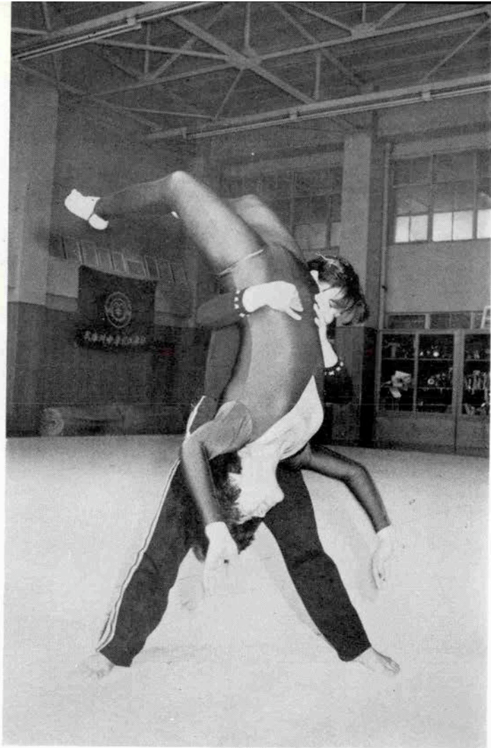
しっかり受けとめてちょうだいよ。重い？ 少しコワイけど、宙に浮いてると気持ちイイ。

ぐ横、今度は平均台の下に彼女は立っていて、私は上でくるりとひっくり返るのである。何度やっても私の足は台にかすりもしなかった。へとへとになって台からおりて来たら、ずらりと並んでみていた学生が、