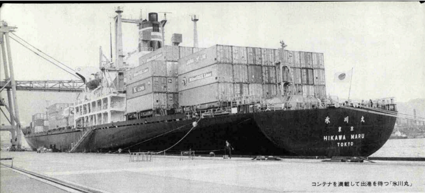
コンテナを満載して出港を待つ「氷川丸」

国際貿易港―神戸港は今年開港一〇〇年を迎えた。そして、今や神戸港は世界最大のコンテナ基地としてコンテナ貨物取扱量は四年連続世界第一位を占めている。この世界一のコンテナポート神戸の歴史は十年前にさかのぼる。