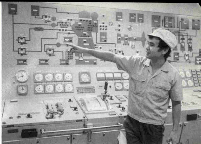
「氷川丸」の心臓部、エンジンのコントロール室。各所に科学の粋が集められている。