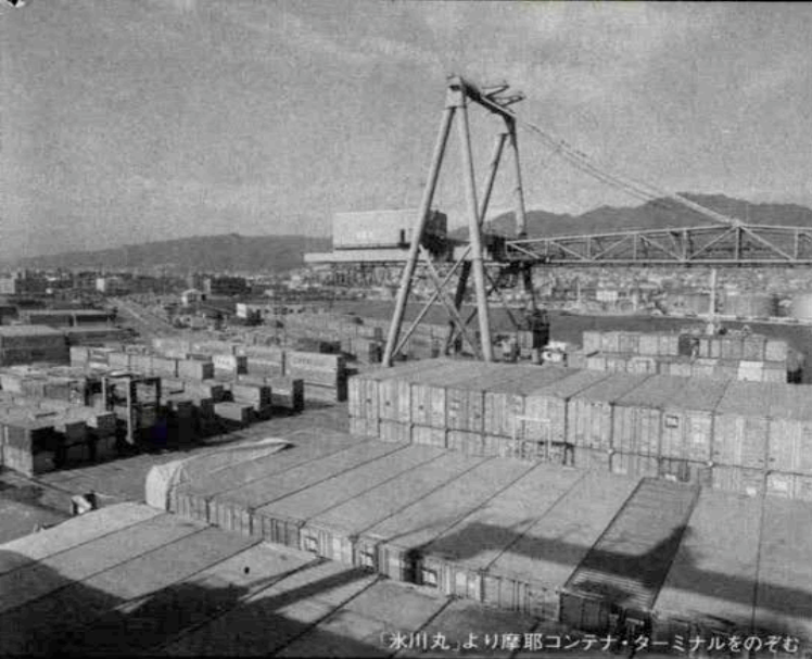
「氷川丸」より摩耶コンテナ・ターミナルをのぞむ