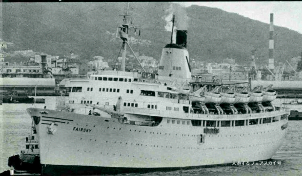
入港するフェアスカイ号