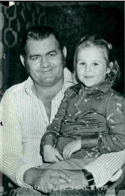
「パパといっしょにコウベに来たの」