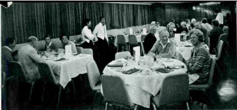
ディナータイム。 船旅での楽しみのひとつ。