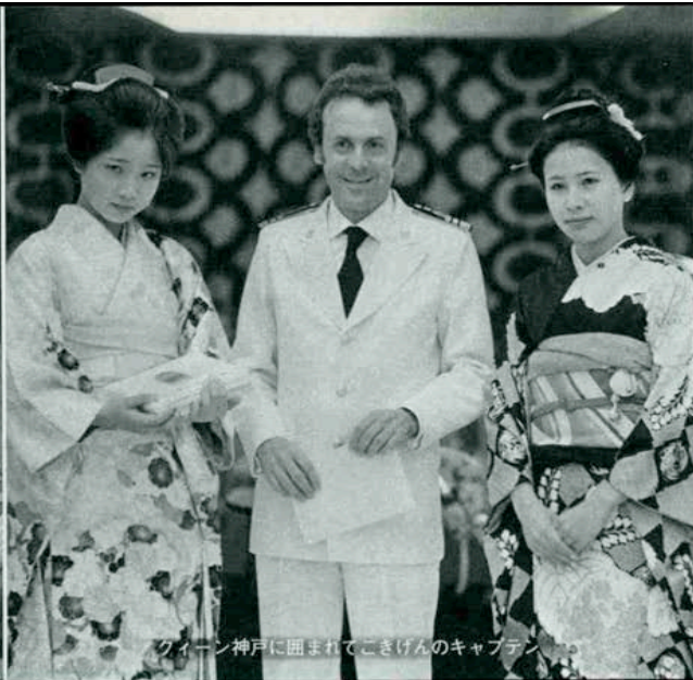
クイーン神戸に囲まれてこきげんのキャプテン