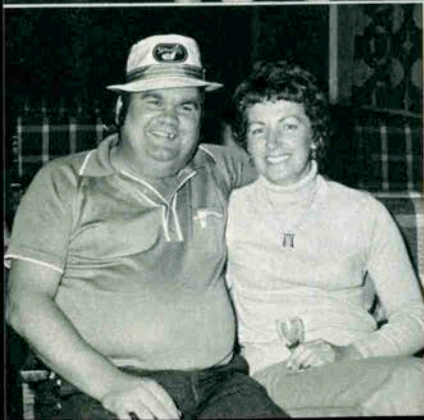
写真上 仲むつまじいバイン夫妻 中 「うまく写真とれよ！」 下 美女と野獣!? ヤケクソダー!

勢をあげている。 「オーイ。俺たちの写真撮ってくれや」と、カメラマンを見つけてせがむので、「三枚うつすと「ワッツ」と歓声を上げてはしゃぎ回る。みなまっ黒に日焼けして、腕に入墨をしている人もいる。酔って海に落ちないよう「ノ」というと「大丈夫! オーストラリアまで泳いで帰