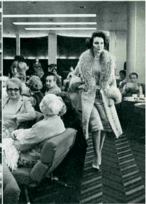
“ニッポンショウ”を見ようと集まったQエリザベスII世号のパセンジャー