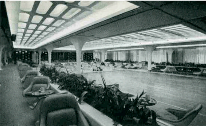
美しいティーンズルームのフロア