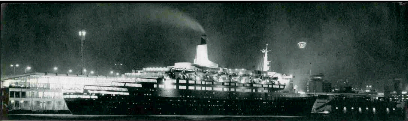
ミナト神戸の夜を彩るQエリザベスII世号

朝もやの神戸港に白・黒・赤の美しい姿を見せたクイーンエリザベスII世号。ついにやって来た海の女王。