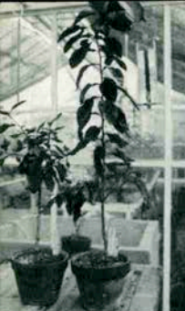
ウイルスの検査 (右が正常)