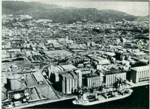
東洋最大の昭和産業のサイロ（第2工区）

ところでこの巨大なサイロだが、神戸港だけで53万トンの収容力がある。といってもピンとこないかもしれないが、四国全部でとれる米の量が45万トンぐらだから神戸のサイロだけで四国全域でとれる米がスッポリと入る。また、兵庫、京都、大阪、