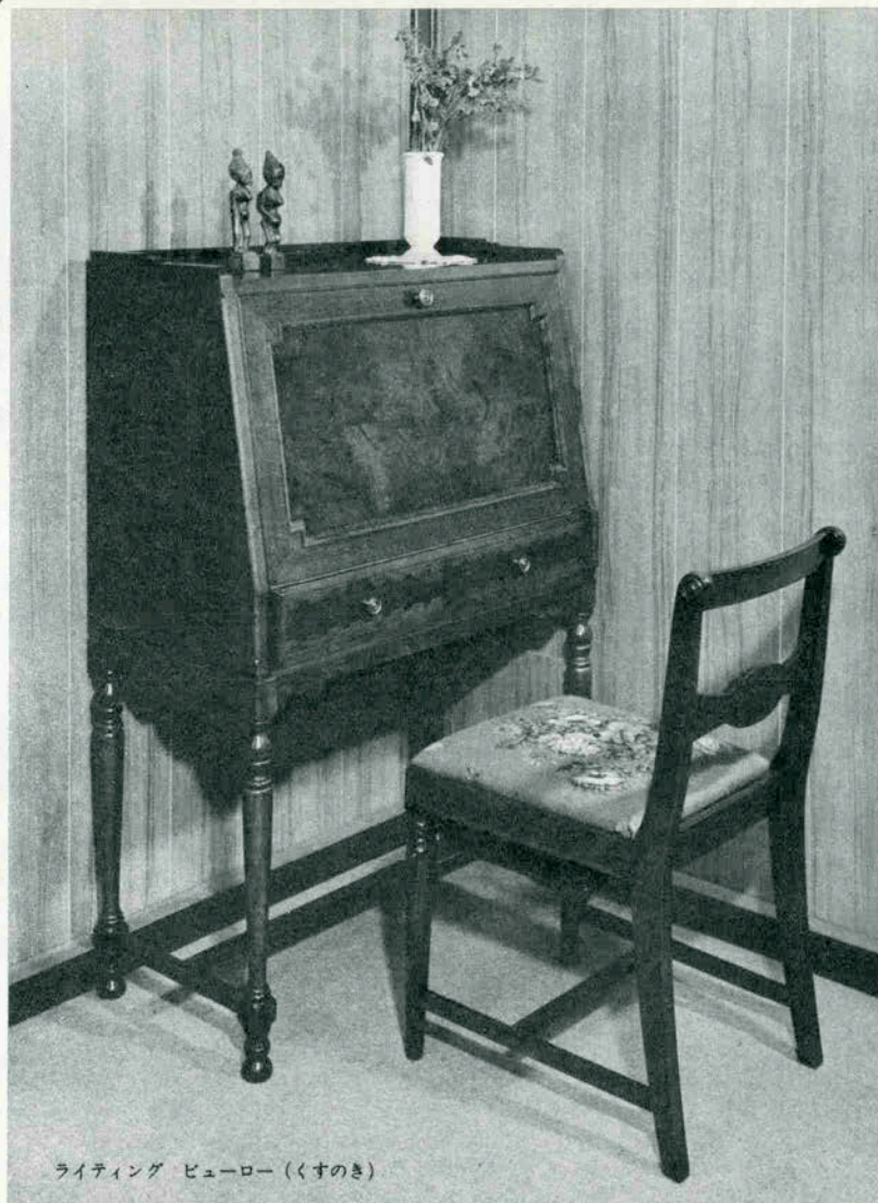
ライティング ビューロー (くすのき)