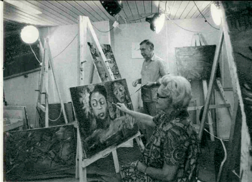
▲船内の絵画教室で熱心に絵を描く船客たち