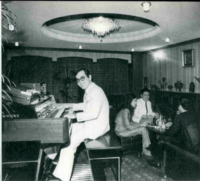
ハモンド/オダイタル