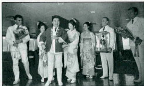
▲ハッピーを着て有頂天のパーサーとクイーン神戸たち