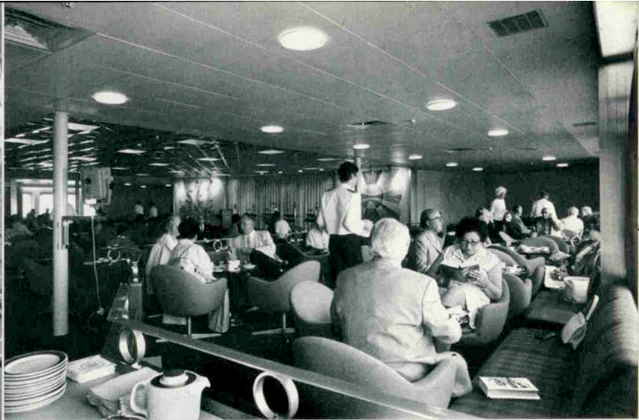
▲ゆったりとしたサロンでコーヒータイムを楽しむ人々