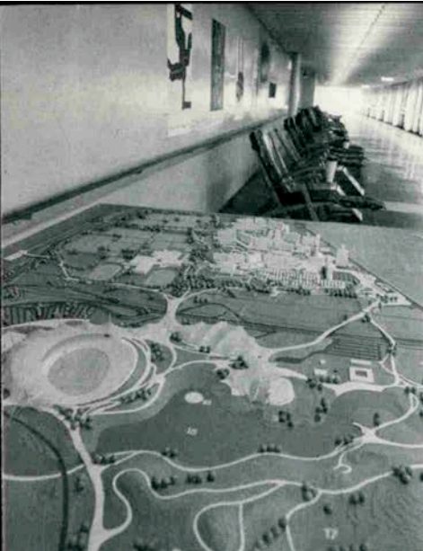
▲デッキに展示されているミュンヘンオリンピック会場の模型