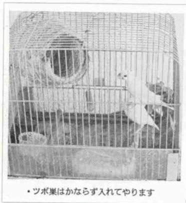
・ツボ果はかならず入れてやります

ただエサを与えるときの注意として、ブンチョウはこれらの穀類の皮をむいて食べるので、エサ入れにそのム