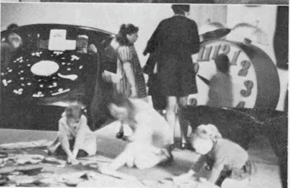
上・博物館外観 中・ユモラスな立看板 下・大きな電話と時計で遊ぶ子供たち