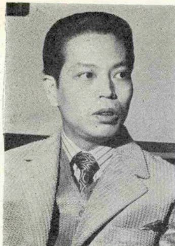
ジャンベン抜くときは美女が傍にいて……