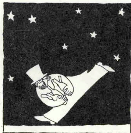
世界中どこでも酒盗人は罪にならない?

ね。それから私共の会社でソ連館やりましてね。ブルジョワ地方のワイン、とてもいいワインでしたね。