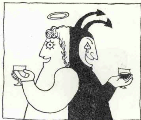
酒は百薬の長？ 百害の長？