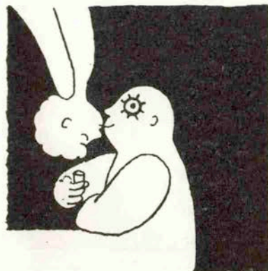
テキーラはチュッチュってキスみたい！