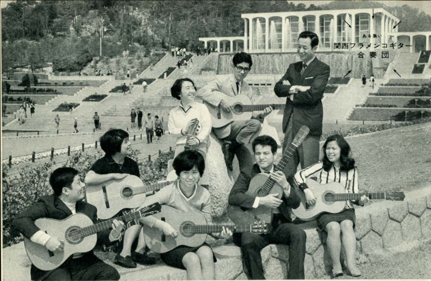
ある集い 関西フラメンコギター 合奏団