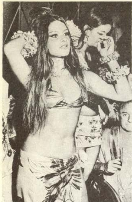
◀情熱的に歌い踊るブラジル娘