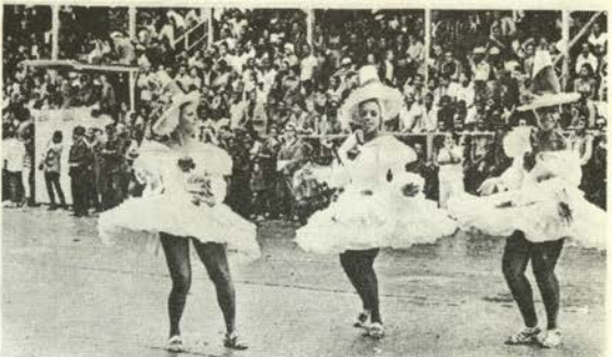
今年のリオのカーニバルでの熱狂的なサンバの踊り