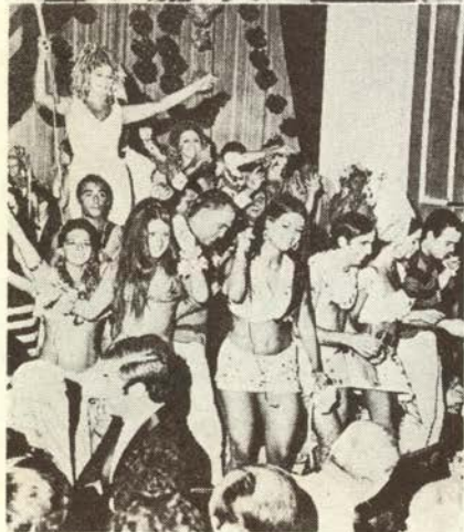
◀クラブにでもサンバ・サンバで人がいっぱい今年のリオ・カリーニバルから

リオはサンバの学校チームがあり ますが、日本でもそういうチーム ができますよといんですが。神戸 で新しい形のカリーニバルを始めよ うとするとき、そういうったグルー プをいかにつくるかが問題です。 F・カルドーナ これもリオで行 なわれていることですが、モモ王 (カリーニバルの王様)を選定して これは王様らしく肥っていないとい いけないので、日本ですとスモウ 取りを呼んでくるのです。(笑)こ のカリーニバルの王様に、カリーニ バルの間は市長よりも強い権限を持 たせるのです。