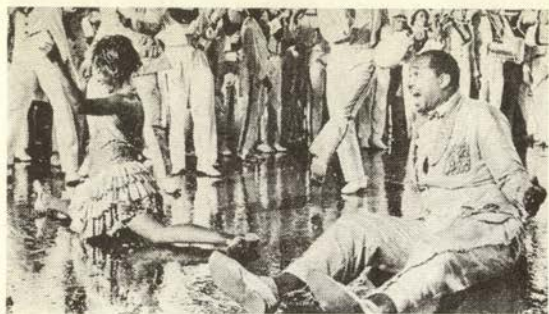
雨の中で踊りくるうブラジル市民

西向 特に戦後、国をあげて何か祭りをするのは全くなくなっちゃって、祭りというところ、信仰とかイ