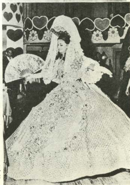
▶ うっとりさせる豪華な衣装／今年のリオ・カーニバルから