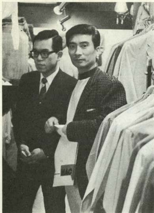
若人の服飾〈マック〉