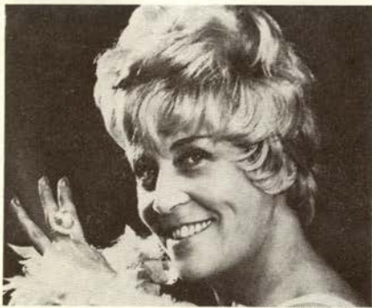
◀写真イベットジロー▶