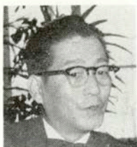
石井 浩 テルは高 いだらう と思われ がちです が、私の 方でも七 八万円で

挙げることはできるので。挙式料が一万三千円、料理も二千円からこぎえますからね。始めにキチンとお決めになった料金を超過するということはないんです。チップも結婚の披露に限ってはすでに入っているんです。但し税金は別ですが、チップは一切ご必配にはおよばないんです。いたいたでも返しております。これは交渉にいらっしやった時に詳しくご説明しております。